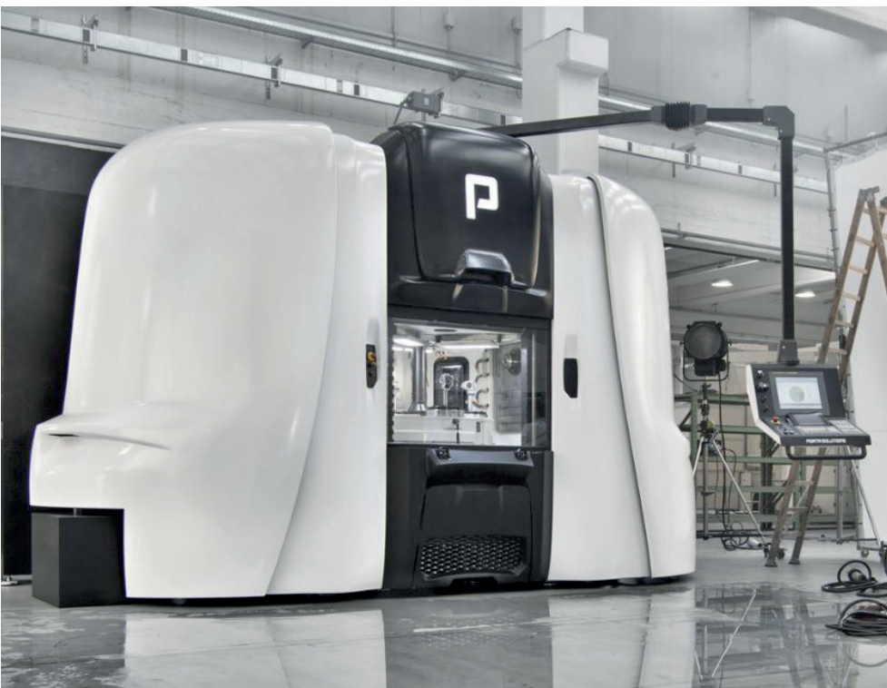
Multicenter 3 mandrini.