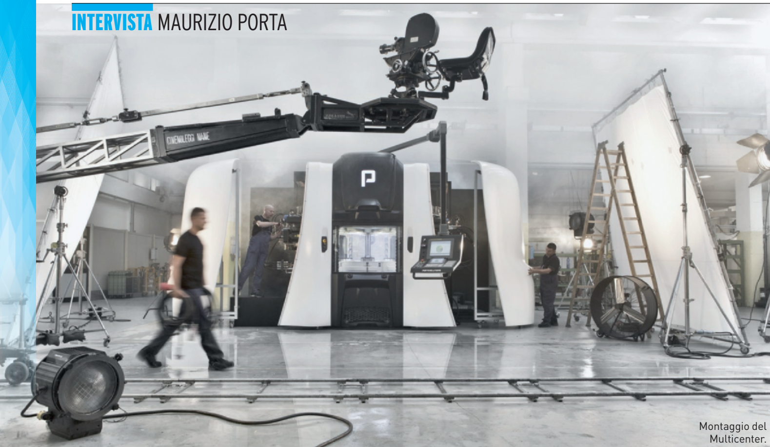
Montaggio del Multicenter.

in primo piano nel settore per consegna, prezzo e prestazioni. È la soluzione ideale per chi ha l'esigenza di rimanere al passo con l'evoluzione del mercato. Chi deve produrre lotti medio-piccoli, con frequenti cambi di produzione, ma anche chi deve realizzare grandi serie, può optare per questa macchina, che rappresenta l'alternativa al bimandrino. Il Multicenter può essere fornito nella versione 3 mandrini e 5 mandrini: queste macchine consentono una concreta ottimizzazione di risorse in manodopera, automazione, costo delle attrezzature, area occupata ed errori su ripresa pezzo.